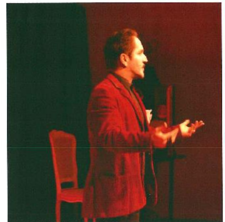
Un Dom Juan indémodable que le public a largement apprécié.

au fil du temps par ces acteurs par moments cocasses, très sérieux à d'autres. C'est tout l'art des acteurs de jouer avec les sentiments de leur public et faire appel à la réflexion.