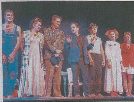
Une autre manière de voir et entendre Molière.

Cette version clownesque donne un éclat inattendu aux personnages, à Dom Juan, fragile libertin, qui se veut libre dans un monde d'apparences et d'hypocri-